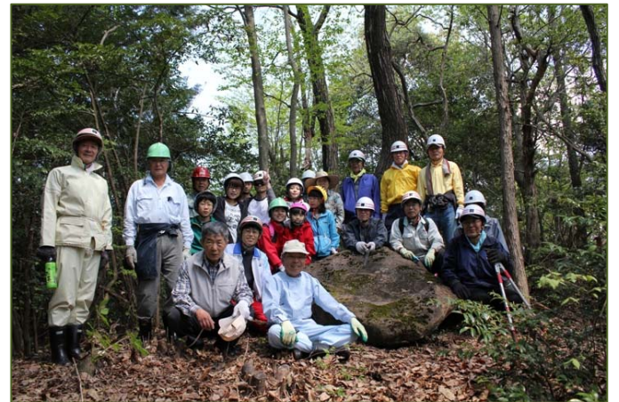
〈硯石の前で記念撮影〉

これらの自然を感じに皆さんも一度出かけて見てはいかがでしょうか? 「大洞の里山つくろう会」の活動は毎月第4土曜日午前中です。