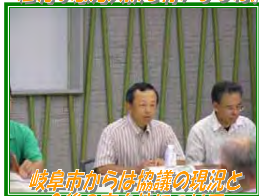
岐阜市からは協議の現況と 今後の方向性について 説明がありました。