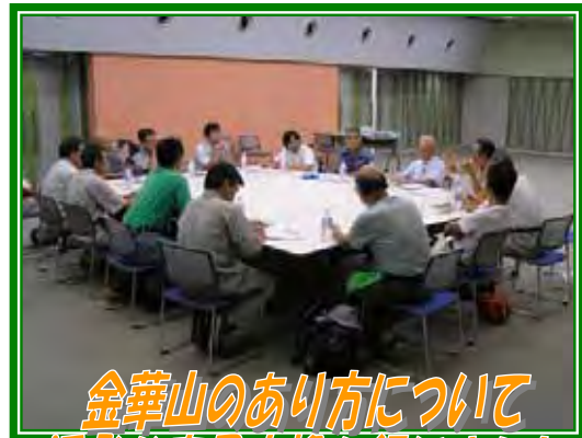
金華山のあり方について 活発な意見交換を行いました。